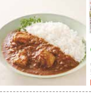
25 はかた地どりカレー ¥508(税込) 糖 特定原材料：小麦 内容量：180g×1袋(1人前) 賞味期限：1年6ヶ月 宮島醤油(株) 辛さ指数 ★★☆☆☆

グリルした「ほかた地どり」を贅沢に盛りつけた。濃厚な味わいと食感が楽しめるカレーです。