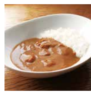
12 クリームチーズカレー ¥712(税込) 糖 特定原材料：小麦・乳成分 内容量：180g×1袋(1人前) 賞味期限：1年 関北都 辛さ指数 ★☆☆☆☆

北海道で作ったクリームチーズをカレーに入れて煮込み、まろやかな味わいのカレーに仕上げました。