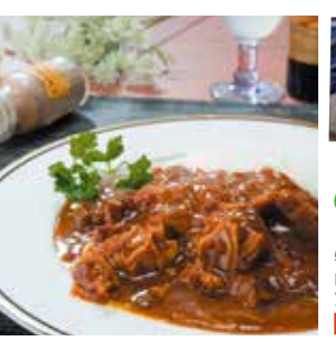
15 三陸帆立ビーフカレー ¥756(税込) 糖 特定原材料：小麦・乳 内容量：200g×1袋(1人前) 賞味期限：2年 鎌田水産(株) 辛さ指数 ★★☆☆☆

大阪で一番古い洋食屋として明治43年に創業。現在この名物カレーに観光客の列ができています。