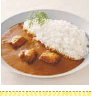
29 かごしま黒豚カレー ¥508(税込) 糖 特定原材料：小麦・乳成分 内容量：180g×1袋(1人前) 賞味期限：1年6ヶ月 宮島醤油(株) 辛さ指数 ★★☆☆☆

NEW 具材が大きめに「ロケット」にして、旨い。全体的に「ロケット」な味わい。濃厚な味わいと食感が楽しめるカレーです。