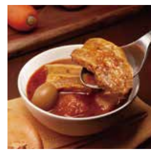
7 富良野スープカレー 厚切り豚バラ肉入り ¥864(税込) 糖 特定原材料：小麦・卵 内容量：260g×1袋(1人前) 賞味期限：730日 関南華園 辛さ指数 ★★☆☆☆

北海道産豚肉、つらねの卵が入った旨みたっぷりのスパイスカレーです。北海道のおいしいお肉がのびる。