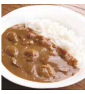
11 北海道産帆立使用 帆立カレー ¥712(税込) 糖 特定原材料：小麦・乳成分 内容量：180g 賞味期限：1年 関北都 辛さ指数 ★★☆☆☆

北海道で作ったクリームチーズをカレーに入れて煮込み、まろやかな味わいのカレーに仕上げました。