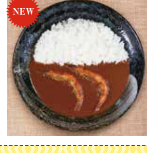
27 薩摩プレミアム 車海老カレー ¥1,080(税込) 糖 特定原材料：小麦・乳成分・えび 内容量：200g 賞味期限：1年 MBC開発(株) 辛さ指数 ★★☆☆☆

NEW 鹿児島県産の車海老を有頭殻付きのまま、贅沢に2層使用したカレーです。素材の旨み、際立つコク、プレミアムレトルトカレーです。