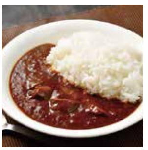
9 富良野ブラックカレー [ビーフ] ¥486(税込) 糖 特定原材料：小麦 内容量：200g×1袋(1人前) 賞味期限：730日 セントラルバック(株) 辛さ指数 ★★☆☆☆

ハムとよく配合したスパイスカレー。玉ねぎ、牛肉の旨味もたっぷり。甘味液も加わった香り高いスープカレー。