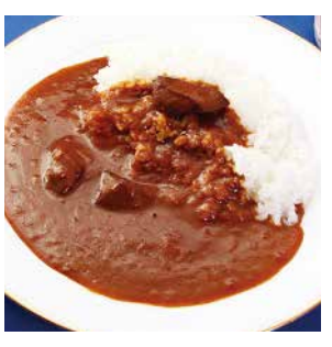
14 牛たんカレー ¥756(税込) 糖 特定原材料：小麦 内容量：200g×1袋(1人前) 賞味期限：2年 五光食品(株) 辛さ指数 ★★☆☆☆

伝統の永年製法で牛たん本来の旨味を引き出したカレー。牛たんの旨味がきめこきめ、凝縮された旨い深い味わいのカレー。