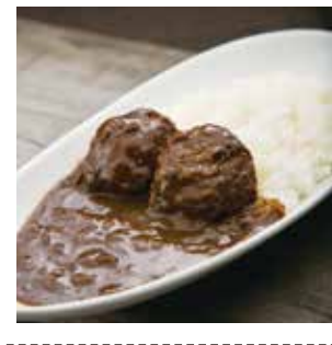
17 みそかつカレー(一口とんかつ2個入り) ¥745(税込) 糖 特定原材料：卵・乳成分・小麦 内容量：200g(一口みそかつ2個含む) 賞味期限：12ヶ月 関フードサービス 辛さ指数 ★☆☆☆☆

八丁味噌で仕上げたカレーに、口どきを2個とこめました。甘辛く旨味が広がる味わいをお楽しみください。