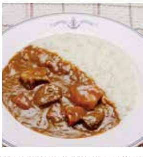
16 よこすか海軍カレー ¥405(税込) 糖 特定原材料：小麦・乳成分 内容量：200g×1袋(1人前) 賞味期限：2年 関ヤチヨ 辛さ指数 ★★☆☆☆

八丁味噌で仕上げたカレーに、口どきを2個とこめました。甘辛く旨味が広がる味わいをお楽しみください。