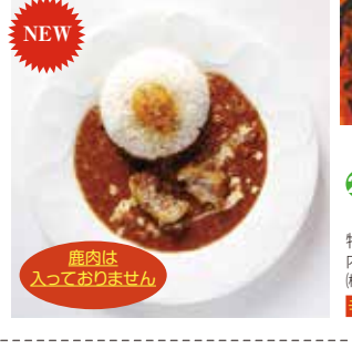
23 奈良鹿ないカレー スパイシー(ビーフ) ¥698(税込) 糖 特定原材料：小麦・乳成分 内容量：200g 賞味期限：2年 関キャニオンスパイス 辛さ指数 ★★☆☆☆

NEW 奈良の名産品を作りたい。想いをこめて開発した「スパイスカレー」。玉ねぎをよく使用し、旨いスパイスカレーに仕上げました。