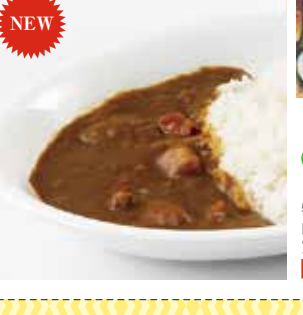
30 昭和懐カレー 中辛 ¥648(税込) 糖 特定原材料：小麦 内容量：180g 賞味期限：730日 関ミッシュン 辛さ指数 ★☆☆☆☆

NEW 具材が大きめに「ロケット」にして、旨い。全体的に「ロケット」な味わい。濃厚な味わいと食感が楽しめるカレーです。