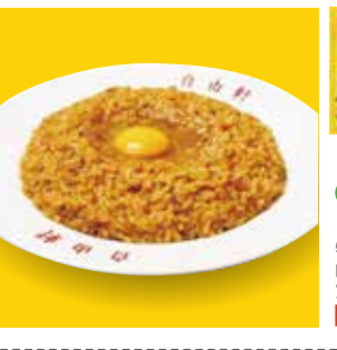
20 大阪・難波 自由軒名物カレー ¥529(税込) 糖 特定原材料：小麦 内容量：カレーベース200g ウスターソース15ml 賞味期限：420日 アイデアパッケージ(株) 辛さ指数 ★★☆☆☆

国産牛の最高峰である松阪牛の旨味をこのまま生かした。贅沢な味わいをお楽しみください。