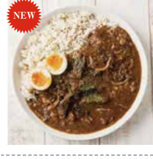
22 「ヤドカレー」 黒毛和牛のスパイスカレー ¥972(税込) 糖 特定原材料：小麦 内容量：220g 賞味期限：2年 関こまこ舎 辛さ指数 ★★☆☆☆

NEW 大阪天満橋で大人気！本格的スパイスカレー専門店「ヤドカレー」。大人気メニューが初のレトルトカレー！