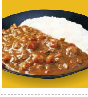
21 松阪牛ビーフカレー ¥583(税込) 糖 特定原材料：小麦 内容量：180g×1袋(1人前) 賞味期限：2年 南伊藤牧場 辛さ指数 ★★☆☆☆

国産牛の最高峰である松阪牛の旨味をこのまま生かした。贅沢な味わいをお楽しみください。