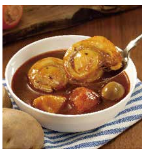
6 富良野スープカレー ほたて2個入り ¥864(税込) 糖 特定原材料：小麦・卵 内容量：260g×1袋(1人前) 賞味期限：730日 関南華園 辛さ指数 ★★☆☆☆

北海道産ホタテ、じがいも人参、つらね卵が入った旨みたっぷりのスパイスカレー。マイルドな味が楽しめます。