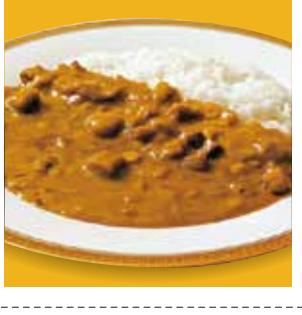
24 神戸牛ビーフカレー ¥583(税込) 糖 特定原材料：小麦 内容量：180g×1袋(1人前) 賞味期限：2年 関善太 辛さ指数 ★★☆☆☆

グリルした「ほかた地どり」を贅沢に盛りつけた。濃厚な味わいと食感が楽しめるカレーです。