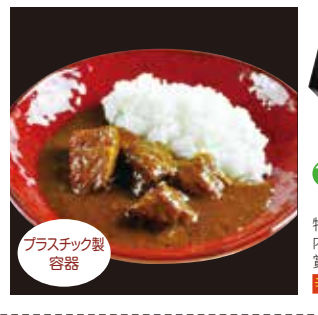
18 あふひ 贅の極み 飛騨牛カレー(2人前) ¥1,620(税込) 糖 特定原材料：小麦・乳成分 内容量：450g(2人前) 賞味期限：1年 関斐フーズディナーズ 辛さ指数 ★★☆☆☆

創業より美味しさのみを追求し続けたい。この味、飛騨産の濃厚な旨味、この頃の玉ねぎを使用。こだわりの味わいを実現しました。