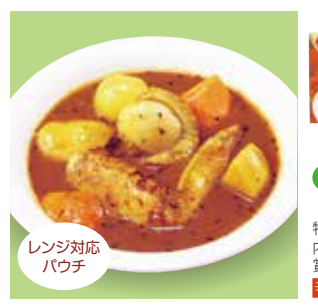
8 北海道 スープカレー ¥1,080(税込) 糖 特定原材料：小麦・乳成分・卵 内容量：380g×1袋(1人前) 賞味期限：6カ月 関寿フーズ 辛さ指数 ★★☆☆☆

つらねのある鶏手羽と野菜をたっぷり使用した旨みたっぷりのスパイスカレーです。深い味わい。本格派スープカレー。