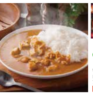
10 富良野バターチキンカレー ¥518(税込) 糖 特定原材料：乳・小麦 内容量：180g×1袋(1人前) 賞味期限：730日 セントラルバック(株) 辛さ指数 ★★☆☆☆

船立ビーフの旨みたっぷりのスパイスカレー。大人を魅了するスパイスな味わいとコクをプラスしたカレーフレンチも納めよう。