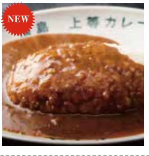
19 甘くて辛い 上等カレー ¥594(税込) 糖 特定原材料：小麦・乳成分 内容量：170g 賞味期限：2年 関キャニオンスパイス 辛さ指数 ★★☆☆☆