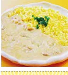
26 博多明太子カレー ¥540(税込) 糖 特定原材料：小麦・乳 内容量：200g×1袋(1人前) 賞味期限：1年 関オフィスシン 辛さ指数 ★★☆☆☆

福岡名産博多明太子をホワイチのカレーソースに閉じ込めました。ピリッとした辛さと明太子の旨味が、チヂミチヂミのカレーです。